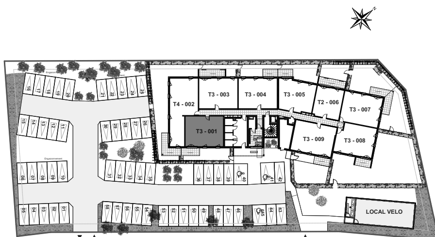
Plan de repérage