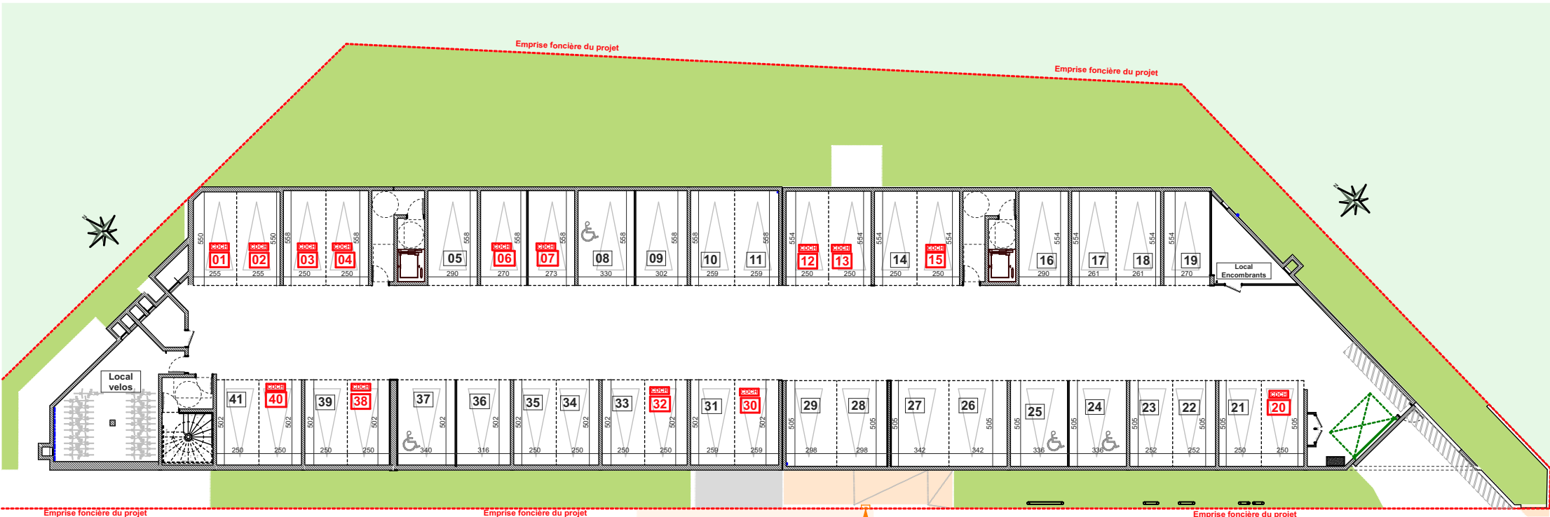
SOUS-SOL -2 BAT A et B