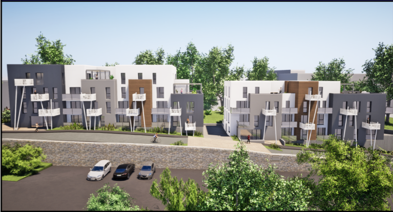
RDC et ETAGE 1 BAT A - ETAGE 1 et 2 BAT B