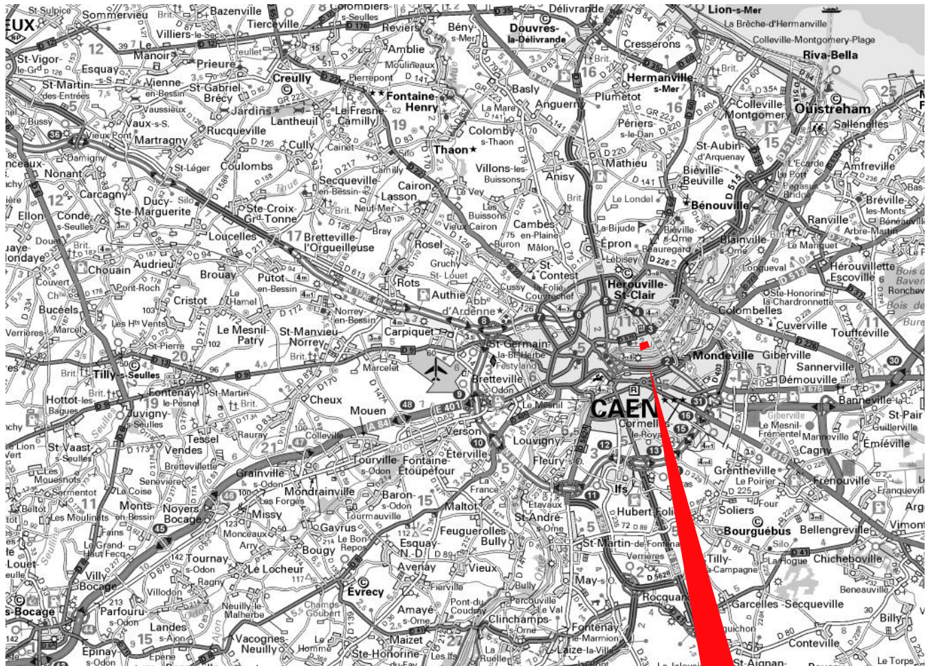
Plan de l'agglomération de Caen